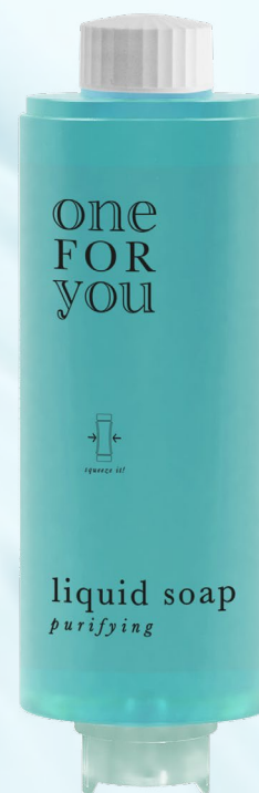
sapone liquido trend plus 320 ml