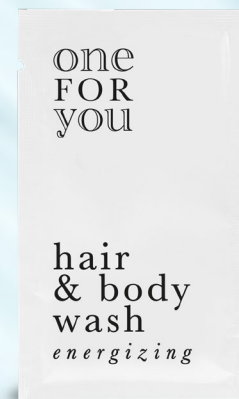
shampoo doccia bustina 10 ml