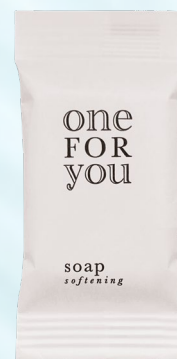
sapone flow pack 10 g