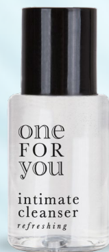
igiene intima flacone 20 ml