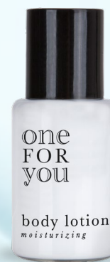
lozione corpo flacone 20 ml