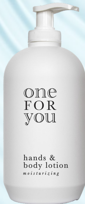
lozione mani e corpo Vogue 480 ml