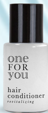
balsamo capelli flacone 20 ml