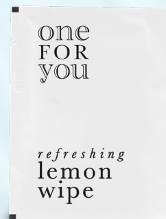
salvietta al limone bustina