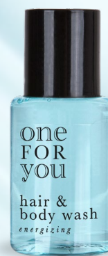
shampoo doccia flacone 20 ml