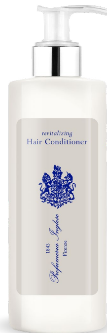
HAIR CONDITIONER cod. 026HC311805 300 ml