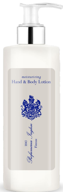
HAND & BODY LOTION cod. 026BL311808 300 ml