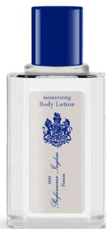
BODY LOTION cod. 026BL311807 50 ml