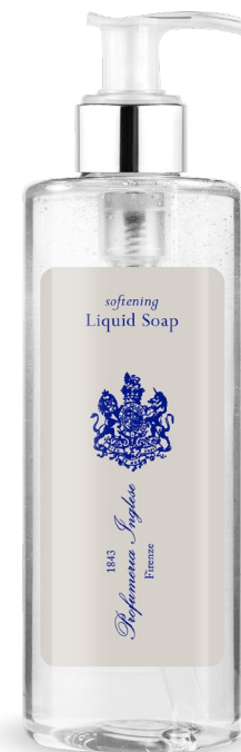
LIQUID SOAP cod. 026LS311800 300 ml