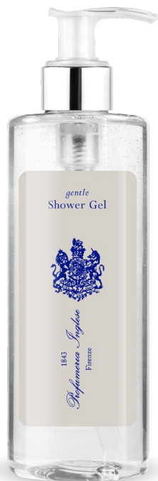
SHOWER GEL cod. 026SG311805 300 ml