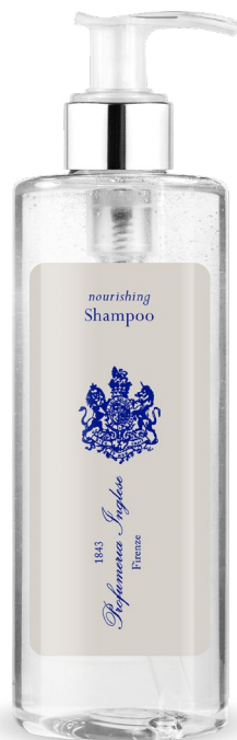
SHAMPOO cod. 026SH311806 300 ml